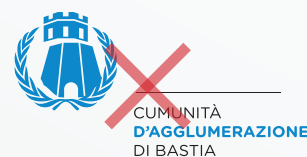
Changement de composition des éléments